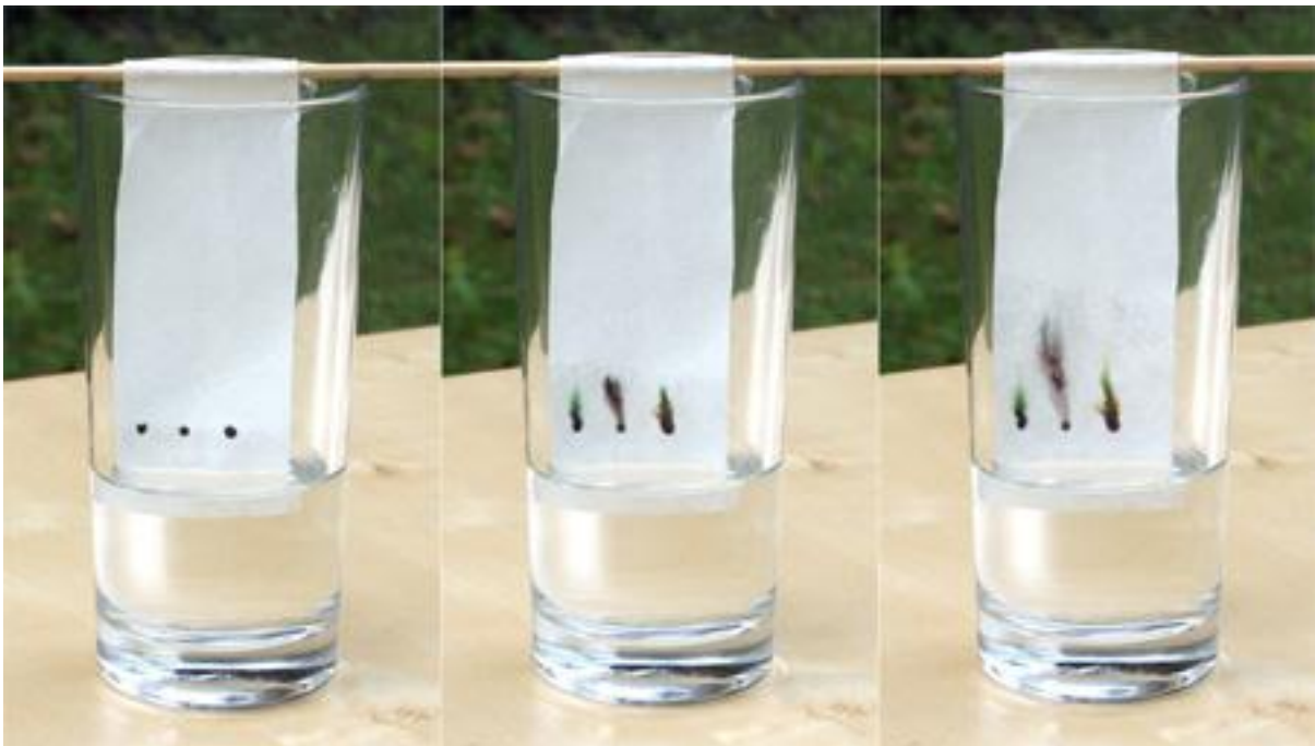
Bild 3: Die Aufspaltung der schwarzen Filzstiftfarbe in bunte Farben.