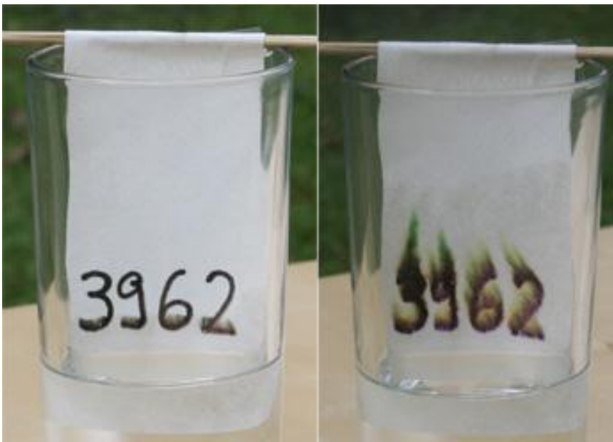
Bild 6: Die Zahlen verlaufen grün wie der Stift von Herrn Wagner (siehe Bild 7)