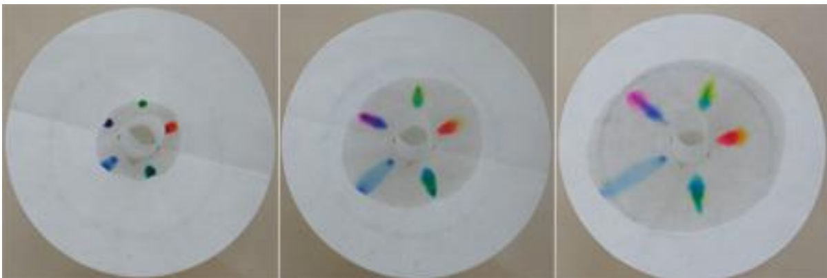
Bild10: Die Farben spalten sich auf und ergeben neue Farben.