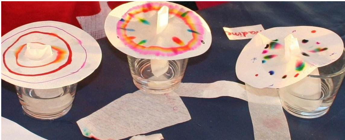
Bild11: Mit Filzstiften bunte „Forscherblumen“ kreieren.