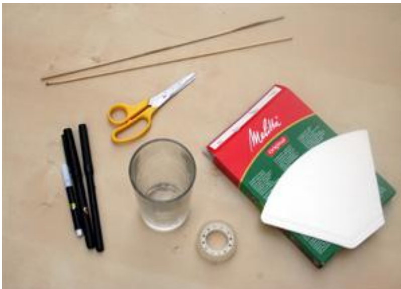
Bild 1: Material für das Experiment mit den schwarzen Filzstiften

So bekommst du Rundfilter: Nimm ein Glas (Ø 6 – 7 cm) als Schablone und schneide aus deinem Papier die entsprechenden Kreise aus.